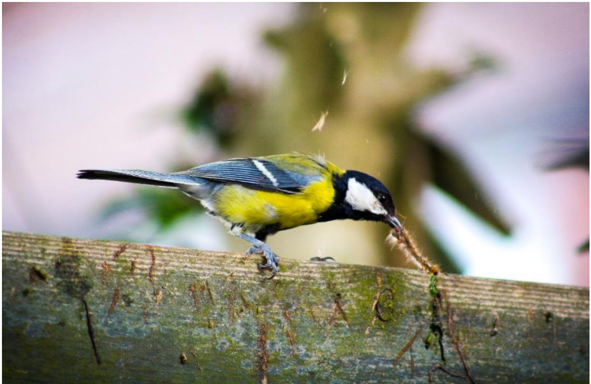
Koolmees, natuurlijke vijand van de eikenprocessierups

Preventie en bestrijding van de Eikenprocessierups in Steenwijkerland