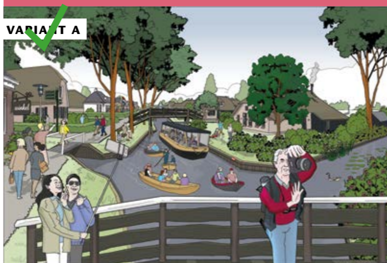
VARIANT A: GEWENST BEELD