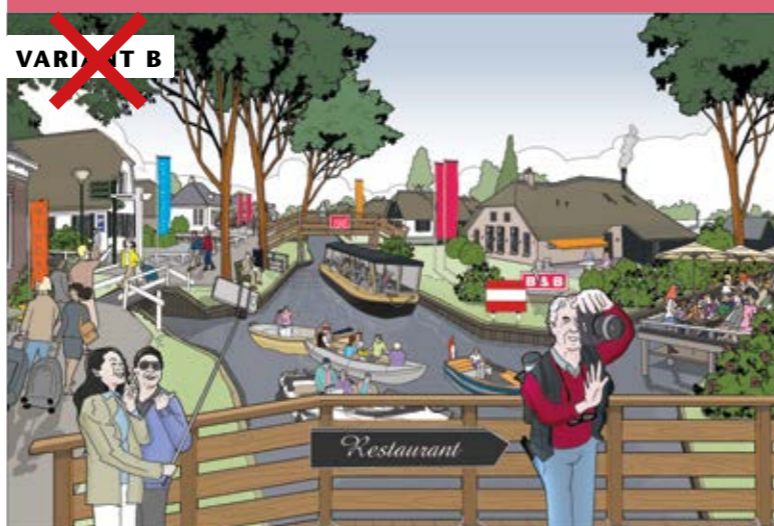
VARIANT B: ONGEWENST BEELD