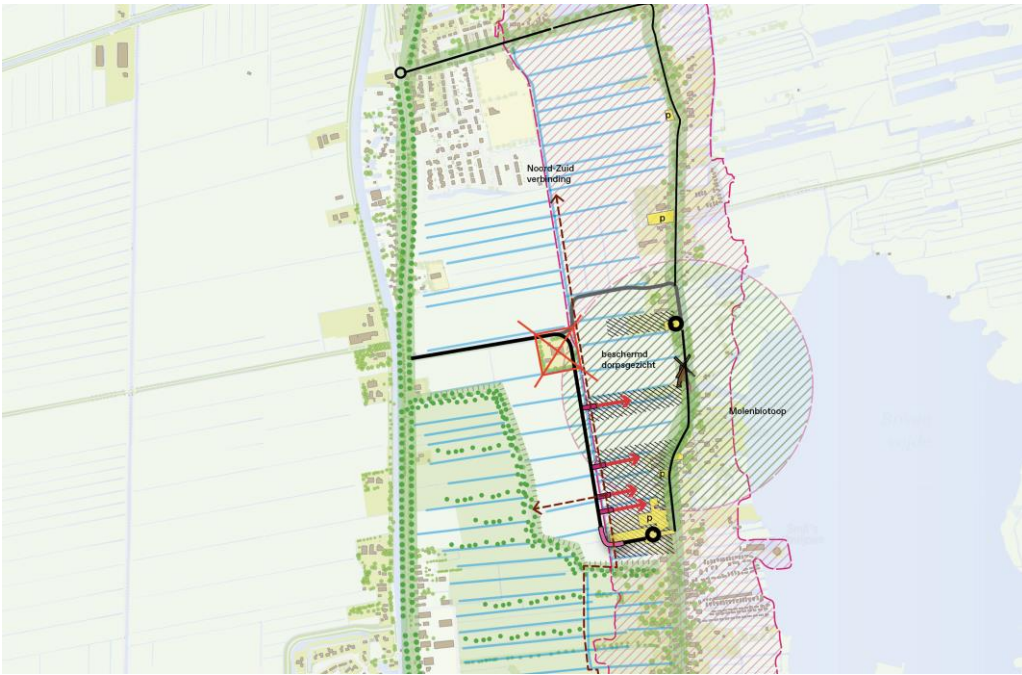
Afbeelding 2 Inzoom op variant Koepad

Weg loopt langs Beschermd Dorpsgezicht. Hoog risico op ongewenste ontwikkelingen in Beschermd Dorpsgezicht en de open molen biotoop, mede omdat dit de achterliggende bedoeling van dit tracé is.