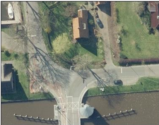
Kanaaldijk – voor