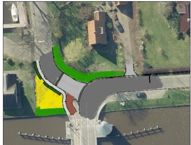
Indruk Kanaaldijk – na