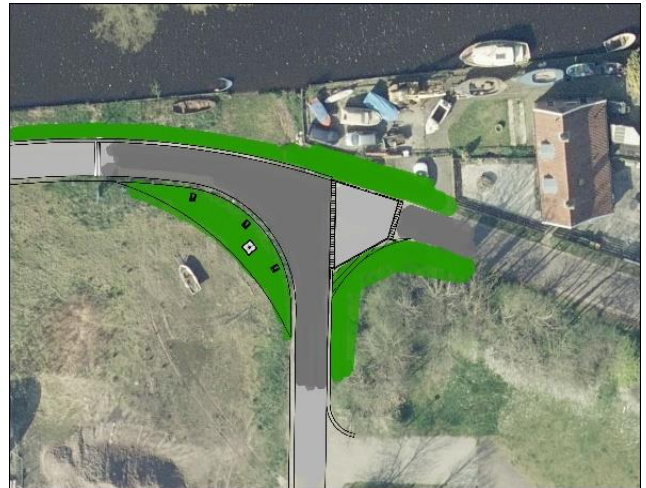
Indruk Jonenweg – na