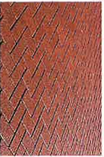
RUBAN MODENA BETONSTRAATSTEEN ROOD