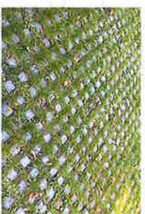
PARKEREN OP GRASTEGEL GRASSPILTEGEL BOSCHBETON