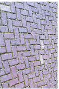
PLATEAU EN MIDDENSTROOK HERGEBUIK KLINKERS