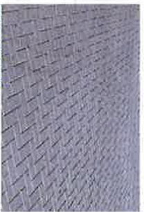
PARKERKOPPELS BETONSTRAATSTEEN GRIS