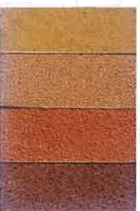
ENTREE SCHOOL SCHEETSIDE DIVERSE KLINKERS