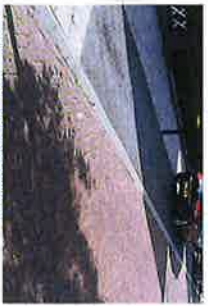
PARKEREN OP TROTTOIRNIVEAU BETONSTRAATSTEEN ANTRACIET