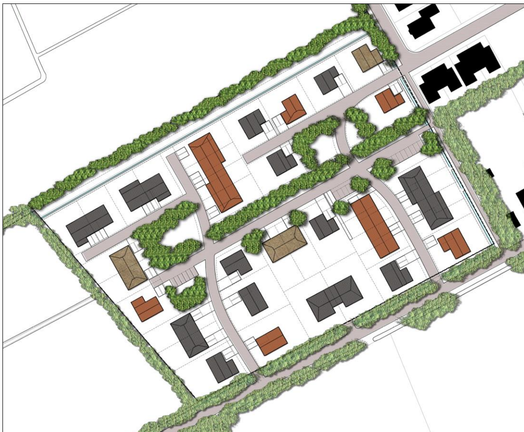
afbeelding 1: overzicht kleurstelling dakbedekking

Voor de drie aangewezen rieten kappen bestaat de vrijheid om te kiezen voor de rood gebakken of blauw gesmoorde pan. Rieten dakbedekking is overal toegestaan.